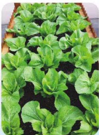
跑馬地天台(朗緣)的菜地