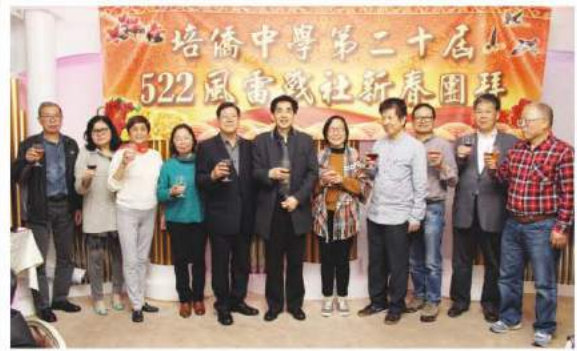
籌委們向大家敬酒