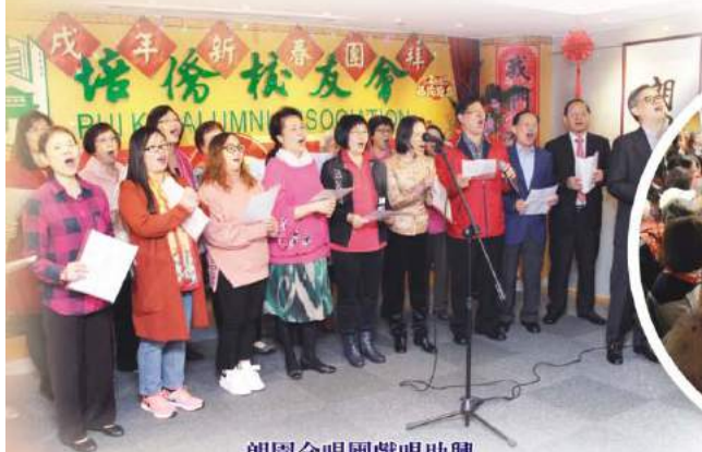
朗園合唱團獻唱助興