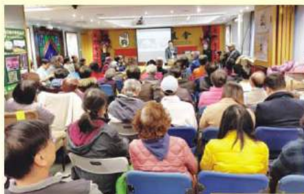
一月份開放日參加人數眾多