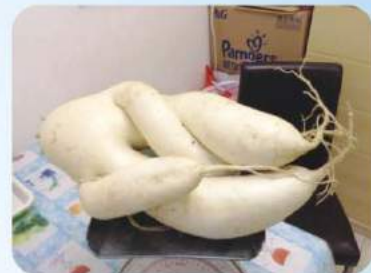
在培僑中學天台朗園種植的人型大蘿蔔