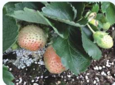
跑馬地天台(朗緣)的果實