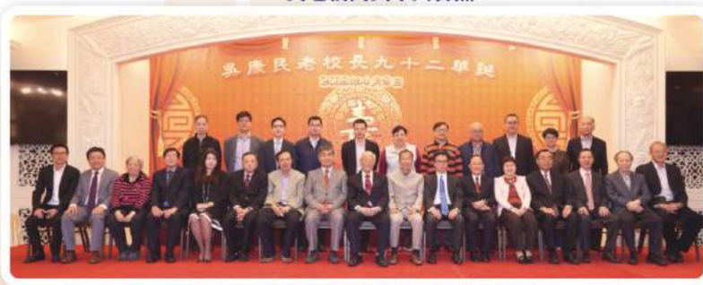
吳老校長與參加宴會的校友會理監事合照