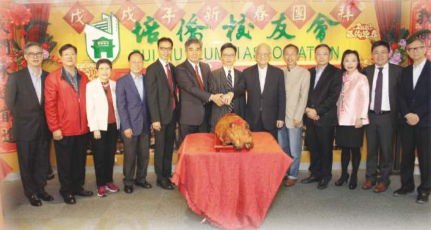
團拜日切金豬儀式

狗年伊始，校友會於3月4日(年十七)舉行了新春團拜。當天早上，校友會熱鬧非常，新老校友歡聚一堂，有些還帶上兒孫。