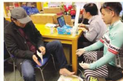
講座前後由30屆雷澤恩校友安排儀器作骨質密度測試