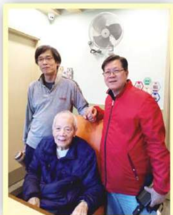
20屆代表向黃老師送上春節祝賀和問候