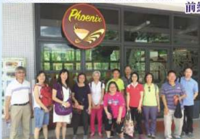
在培僑書院內的朗園餐廳前合照