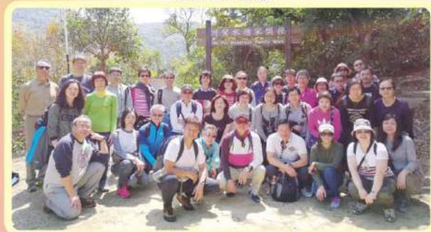
2 28屆長青社一年一度新春行大運·漫遊河貝水塘