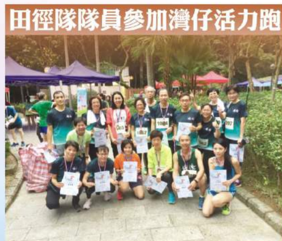
田徑隊隊員參加灣仔活力跑