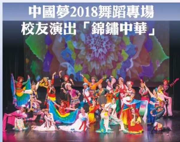
中國夢2018舞蹈專場 校友演出「錦繡中華」