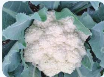
在培僑中學天台朗園種的椰菜花