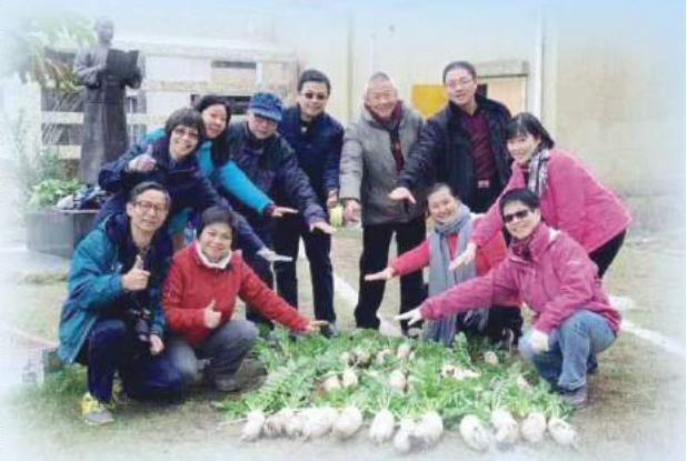
培僑中學天台朗園成員合照

農友不怕耕種難，寒冬炎夏只等閒。 風吹雨打無所懼，缺水無電亦不煩。 扶老攜幼來參觀，蘿蔔黃瓜載譽還。 有機產品爽又甜，營養豐富免藥患。 友情重於瓜果蔬，相互關懷勝金蘭。 十載耕耘匆匆過，瓜菜滿園盡開顏。