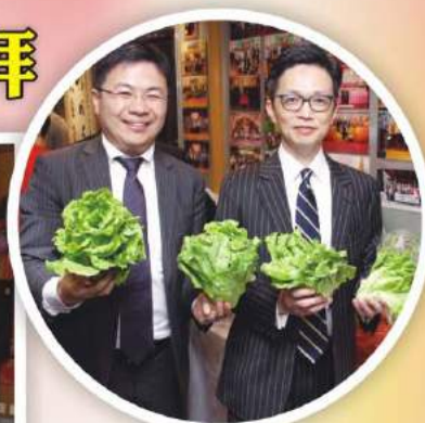
朗園農場送來給校友的新鮮生菜