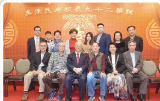
吳老校長與家人合照