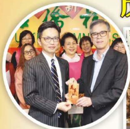
周會長代表校友會送合唱團新年利是