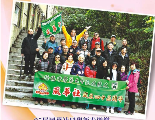
25屆風華社同學新春遊樂

『春行大運步飛揚，結伴同遊過嶺崗。 若夢園中藏故事，屯門徑上賞風光。 登坡踏盡千階石，頓足遙看萬棟房。 三聖邨旁嚐美食，酒酣相醉又何妨。』