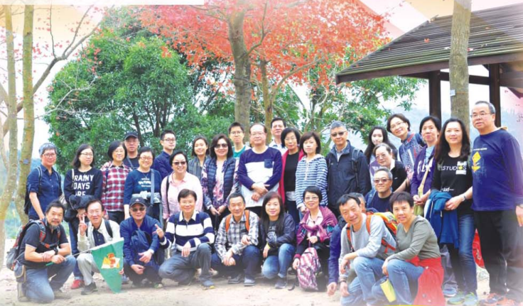
28屆長青社一年一度新春行大運——遊大棠賞紅葉