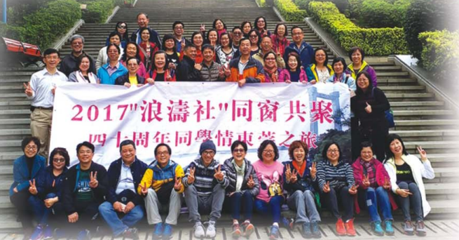
30屆浪濤社慶祝四十周年同窗共聚