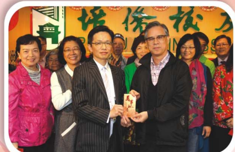
周會長代表校友會致送大利是予合唱團