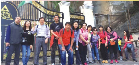
在朗園校道門前合照

當校友們途經朗園校道時，都非常雀躍，紛紛在校道門前留影。沿途上，大家有說有笑，不覺間已到終點。原來大會還向每一位參與的人士發出證書。這活動既健康，又有意義！