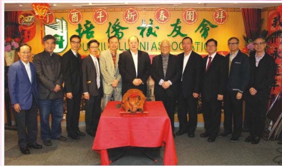
切燒豬儀式前合照