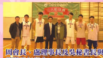
周會長、盧理事長及吳秘書長與得獎青年組合