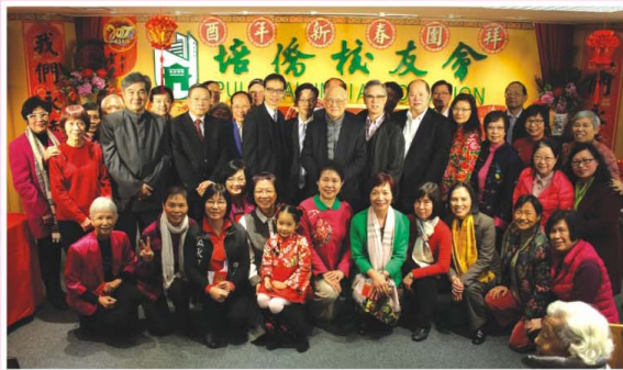
合唱團與校長及會長們合照留念