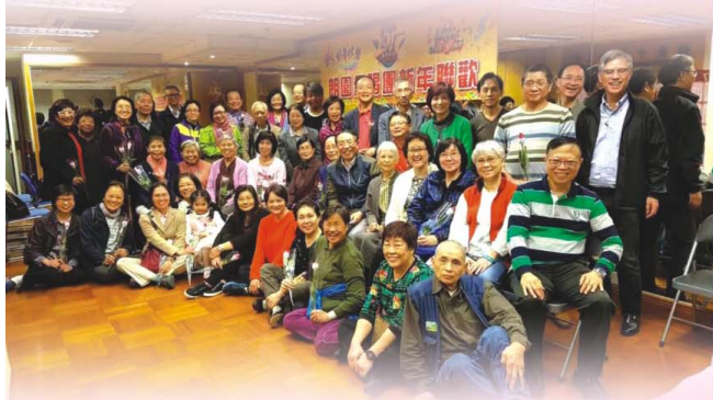
合唱團聯歡大合照