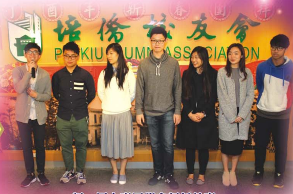
新一屆大專同學會新任幹事