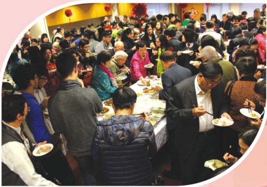
團拜校友們開餐歡聚