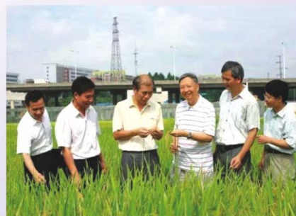
國家重點學科作物遺傳育種團隊在田間觀察水稻生長情況

他的學術成就主要有：協助丁穎院士開展《中國水稻品種對光照和溫度條件反應特性》的研究，獲得1978年全國科學大會獎。對栽培稻和野生稻的親緣關係進行研究、對水稻矮生性遺傳規律進行研究和對水稻雄性不育性的細胞學和遺傳基礎進行研究。成功地培育出等基因恢復系「珍汕97A」，提出水稻「特異親和基因」的新學術觀點，並提出應用「特異親和基因」以克服籼雜種不育性的設想。這些研究成果，對我國的水稻遺傳育種研究和實踐具有重要意義。