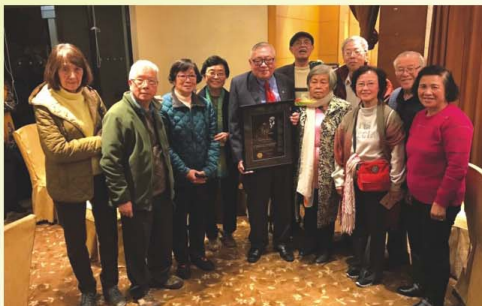
第11屆校友出席頒獎禮與岑嘉評合影

現年76歲第11屆岑嘉評校友，自1971年起於香港中文大學數學系任教和從事研究，至今已發表過大約400篇數學論文。1985年，他成立了國際數學奧林匹克香港委員會，並擔任主席至今。他大力推動香港的數學教育，提升學生的數學水平，被稱為『香港數學奧林匹克之父』。2016年，更為香港爭得國際奧林匹克數學競賽主辦權。憑藉30多年對香港以至東南亞地區的數學教育作出的重大貢獻，國際數學競賽聯盟向他頒發『保羅·埃爾德斯數學大獎』，以作表彰。他是首位獲得這個殊榮的香港學者。