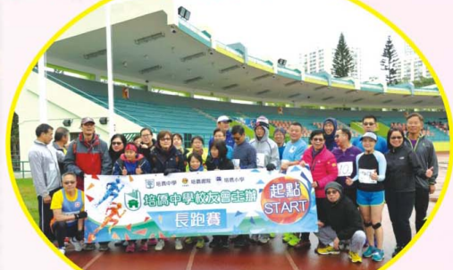
田徑隊參加校友會主辦的長跑賽