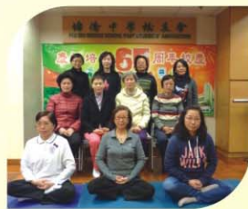
養生班其中 一部份學員