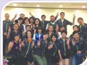
培友田徑隊在慶功晚宴中合照