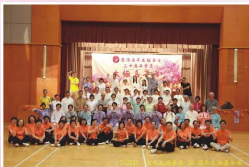
2015年7月1日太極班學員參加交流活動