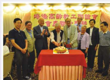
高齡教工會慶90,80,70壽星 切生日蛋糕