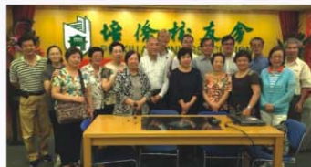
第19屆校友於9月2日校友會開放日合照