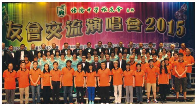
校友會會長及校友義工與朗園合唱團合照