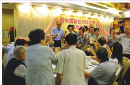
高齡教工會慶理事敬茶