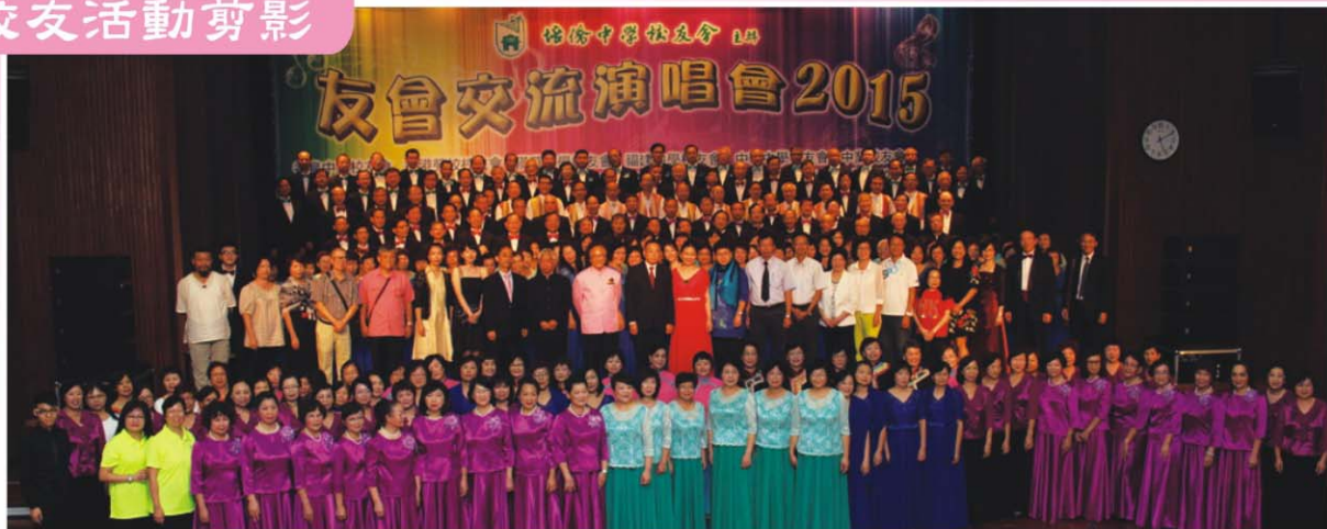
友會演出者全體大合照