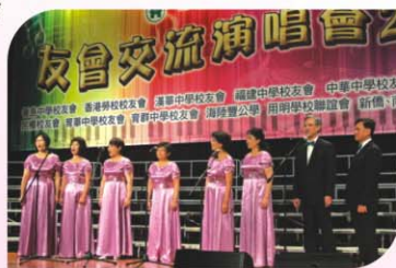
朗園合唱團男女聲小組唱

最後一曲《同一首歌》，二百多位演員齊集的四聲大合唱，場面壯觀，把表演帶上了高潮！