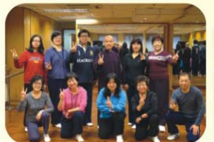
太極班學員與老師