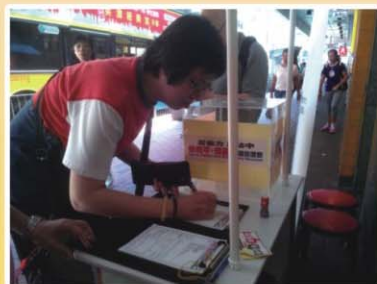
封老師女兒7月30日第一個到來簽名