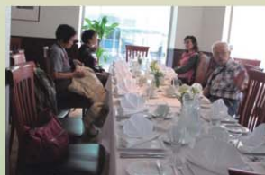
Naboen Pub & Restaurant 內觀

原來，這館子獲餐廳/美食評論（TripAdvisor）的5分滿分評，是卑爾根2014年最棒的餐廳榜首！