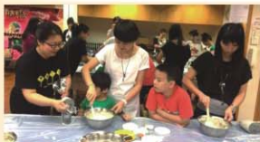
蛋糕班是很好的親子活動