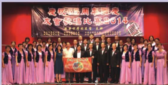
在台上演出後留念