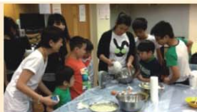
校友子女是蛋糕班的主角