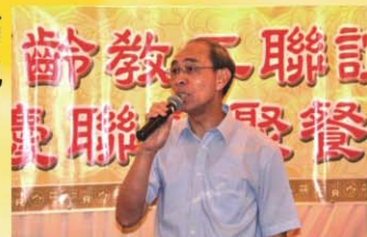
高齡教工會會慶上董事長講話