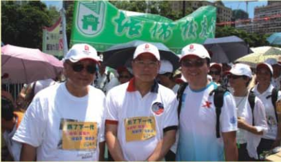
黃會長、理事長、秘書長帶領大遊行