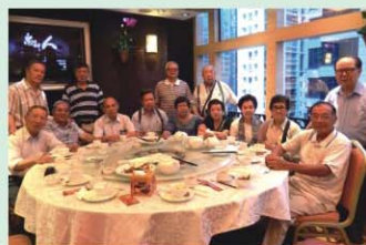
12屆晨曦社同學 7月30日聚會商討會慶事

7月30日，晨曦社同學，在銅鑼灣廣場二期太湖海鮮酒家，每月的定期茶聚上，商討了慶祝畢業55周年的活動安排。時間仍然是原定的11月11日。初步估計會有20人左右參加，目前還在聯絡海外的同學。席上大家還拍了合照。