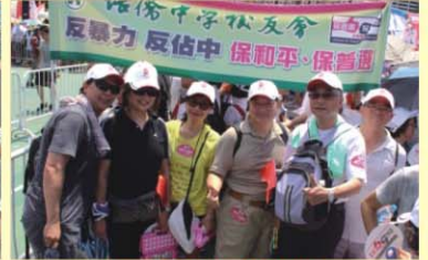
反暴力橫額前合照

「誰能救香港？只有香港人民！廣大的中間群眾，起來吧！起來制止反中亂港的行動蔓延！」這是吳康民老校長於7月4日，在報章上發表的話。