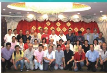
25屆7月12日社慶聯歡大合照