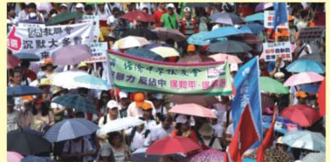
培僑的旗幟在隊伍中

4屆已80歲以上高齡的學長，也包括了剛畢業的年青校友，總之是老、中、青校友，為了一件如此重要的事情聚集在一起來了。我們的隊伍在1時30分後出發，下午4時前已順利完成了遊行。以我們的實際行動，表達我們制止「反中亂港」的強烈呼聲！