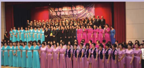
參加9月7日友會歌唱比賽與其他友會團員一起合照