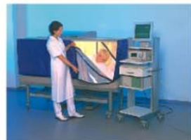
自然醫學(圖為全身熱療)