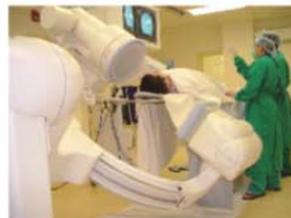
西醫(圖為微創介入治療)