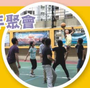
46屆校友在學 校籃球場打球

時光飛逝，由中五畢業至今已經20年了。大家離開母校很長時間。去年校慶聚餐時，我們幾位同學萌起了聚會的念頭。有很多同學已經失去聯絡，幸好在校友會的幫助下，我們找到了部份同學。學校借出場地給我們使用。