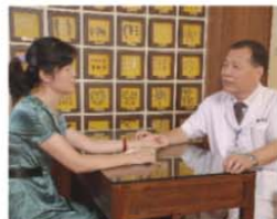
中醫(圖為中醫辨證治療)