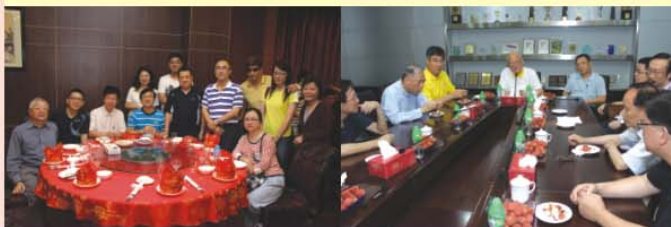
▲ 到訪常理事歡聚一堂